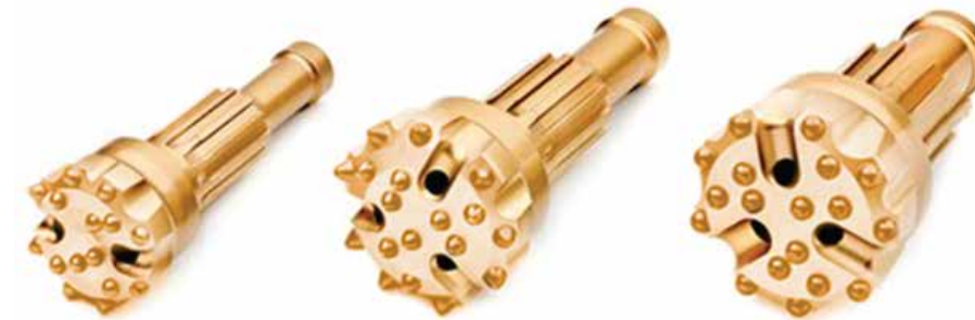
Diámetro de 1/8 pulg