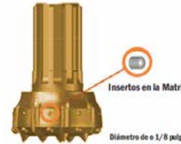
Insertos en la Matriz