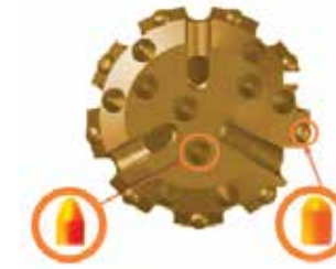
BROCA MIXTA (Insertos Balísticos y Esféricos)

DTH BITS están equipados con botones de carburo en diversas configuraciones, formas y diseños garantizando tasas de penetración máximas, buen lavado y larga vida útil. Para terrenos muy abrasivos nuestros diseños de brocas mixtas cuentan con insertos balísticos en el centro generando mayor ataque; del mismo modo, cuenta con insertos esféricos en el contorno para reforzar la broca.